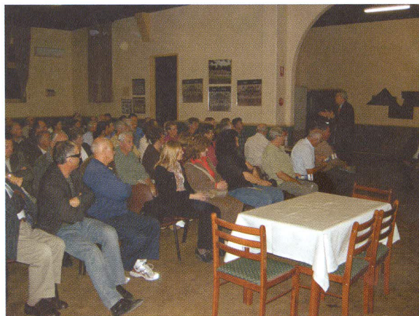
Slika 2. Predavanja hrvatskim iseljenicima u Melbournu.