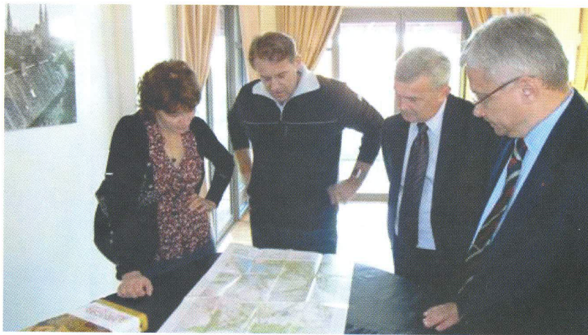
Slika 4. Susret s veleposlanikom Vicencijem Biukom u hrvatskom veleposlanstvu u Canberri.

Prezentaciju u Canberri 16. travnja 2010., u prostorijama Hrvatskoga kluba Deakin, organiziralo je Veleposlanstvo Republike Hrvatske u Australiji. Prije prezentacije delegacija je posjetila Veleposlanstvo i održala uvodni sastanak s veleposlanikom Vicencijem Biukom (slika 4) razmijenivši informacije o provedbi reforme zemljišne administracije, odnosno o