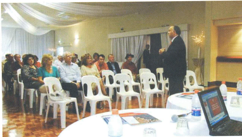
Slika 5. Predavanja hrvatskim iseljenicima u Canberri.

Na prezentaciji u Canberri (slika 5) bilo je prisutno šezdesetak hrvatskih iseljenika koji su pokazali vrlo veliku zainteresiranost za temu o reformi zemljišne administracije. Postavljali su mnoga pitanja vezana uz katastar i uknjižbu vlasništva, temeljena na konkretnim individualnim primjerima iz života.